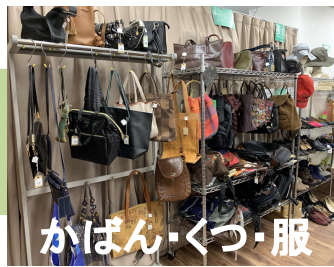
かばん・くつ・服