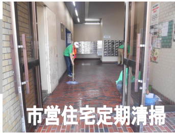
市営住宅定期清掃