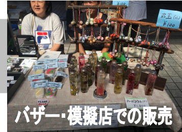
バザー・模擬店での販売

「就労のための訓練がしたい」という方々へ、より実践的な訓練の機会が得られるようリユース&チャリティーショップ「Re☆ショップなかた byぐるっぺ」を運営しています。